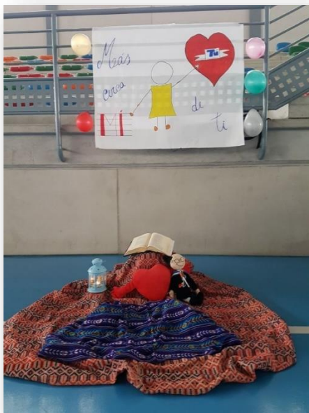
Ambientación del espacio 'Más cerca de Ti' en la convivencia de Alicante

Los locutores, muchas veces ataviados con sus características vestimentas, presentaban las noticias más locas del día y daban paso a los distintos programas.