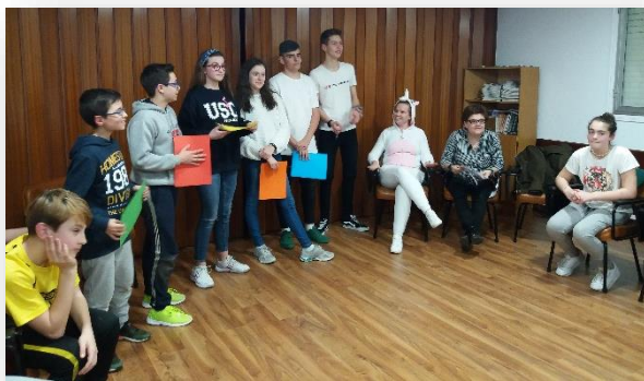
Un momento de la convivencia en Dorrón

Todos estos programas nos acercaron más al P. Faustino desde sus diversas facetas y nos ayudaron a reflexionar sobre cómo andábamos de fidelidad. Constatamos la fidelidad constante del amor de Dios hacia nosotros y la necesidad de responderle con la misma radicalidad.