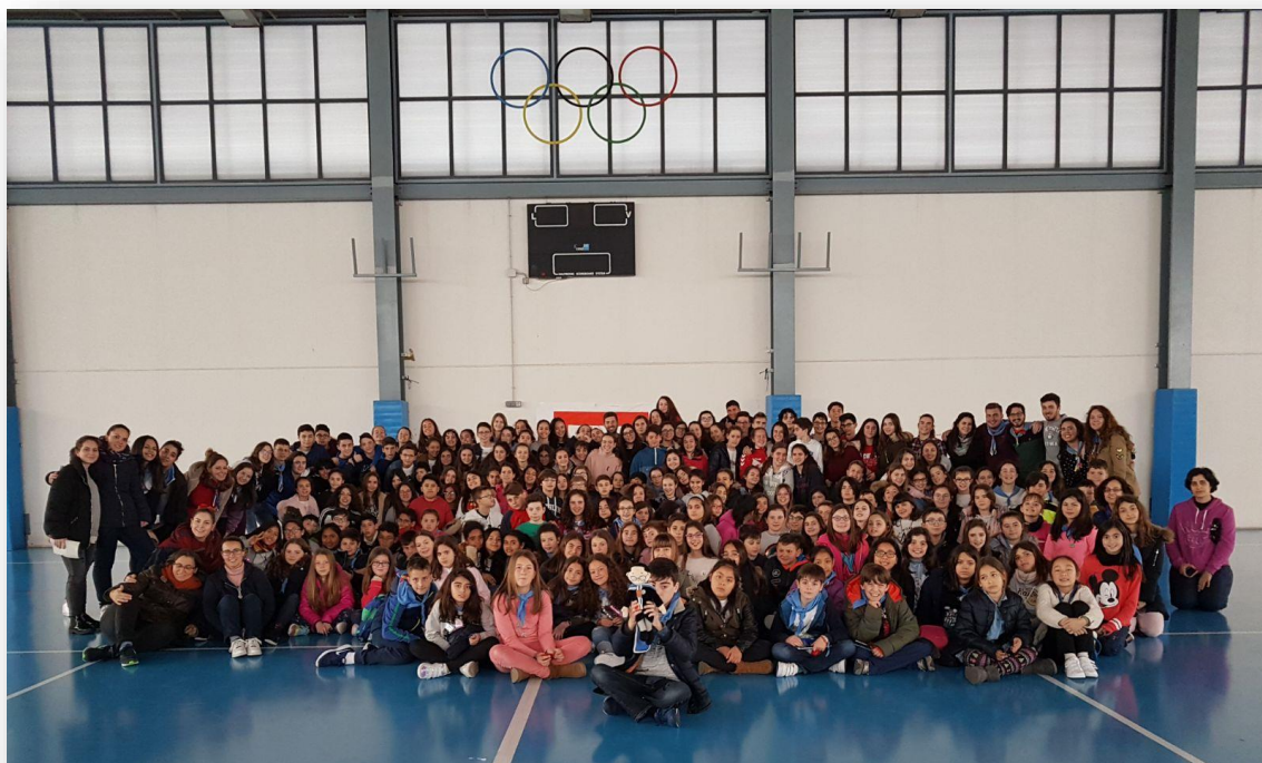
Participantes en la convivencia intercolegial en Alicante