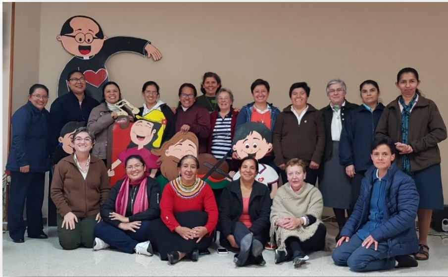
Hermanas que participan en la formación permanente