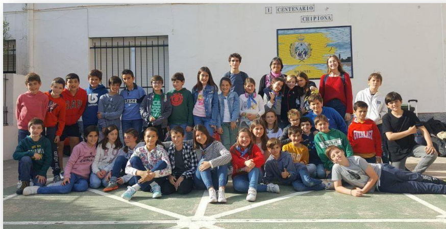
Participantes en la convivencia en Chipiona

Uno de los programas más esperados por todos fue nuestro magazine nocturno, After eight . Un programa de competición en baile, cantos, habilidades... por equipos equipos, con un experto jurado que puntuaba y premiaba al equipo vencedor.