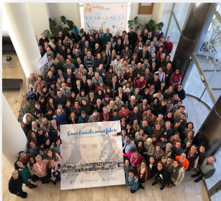
Grupo de participantes en el Simposio de educación

Y seamos maestros capaces de suscitar la admiración a la creación a la propia profundidad, capaces de dialogar mirando a los ojos a los niños, para que se sientan queridos y seguros de que confiamos en ellos; capaces de hacer de cada momento educativo un acontecimiento que afecta a la vida, y hace crecer al alumno y al educador; capaces de llevar al alumno allí donde el silencio habla y nos hace tomar conciencia de quiénes somos y nos hace abrirnos al otro; capaces de ofrecer palabras positivas de reconocimiento de valoración, de esperanza; capaces de cultivar el buen humor y la alegría, y capaces de dar testimonio de nuestra identidad cristiana.