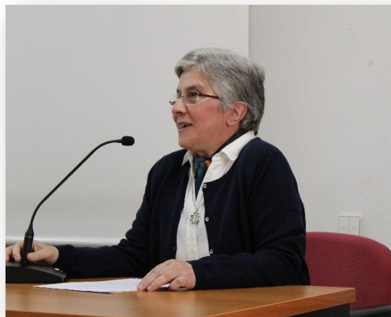
M.Sacramento dirigiendo unas palabras a los participantes en el encuentro

El compartir fraterno posterior, tanto en los grupos, como en la eucaristía, nos sirvieron de envío para lanzarnos a la