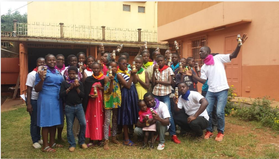
Junioras calasancias, postulante escolapio y voluntarios junto a algunos niños del campamento