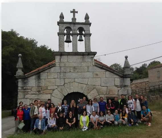
Grupo participante en el retiro – convivencia delante de la capilla de san Cibrao, preparados para iniciar el día

Las dinámicas puestas en marcha sirvieron para irnos acercando unos a otros y compartir. Recordar al Padre Faustino, ahora como San Faustino, me acercó más a su figura. Cómo desde la humildad y la sencillez una persona llega a hacer y ser lo que él hizo y fue.