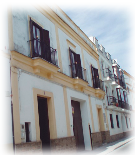
Calle Mar. En 1885 se aprobaron las Bases de la Institución Hijas de la Divina Pastora