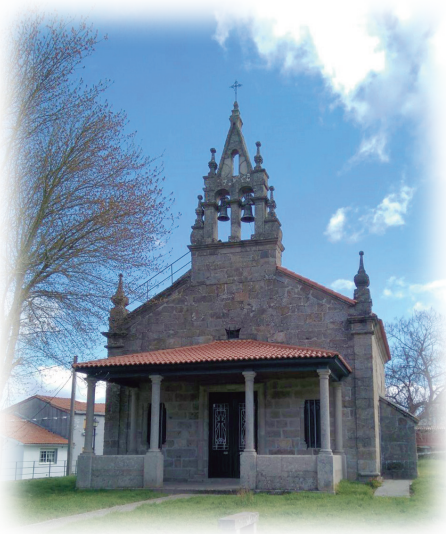
Capilla Ntra. Sra. de la Encarnación. Celanova