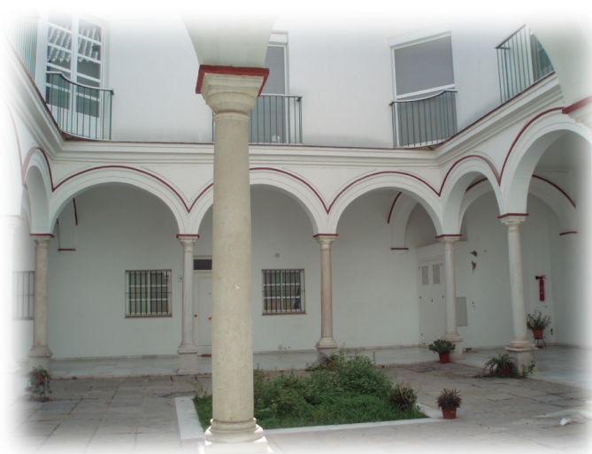
Colegio Divina Pastora en calle Bolsa, 1887 (alquilado)