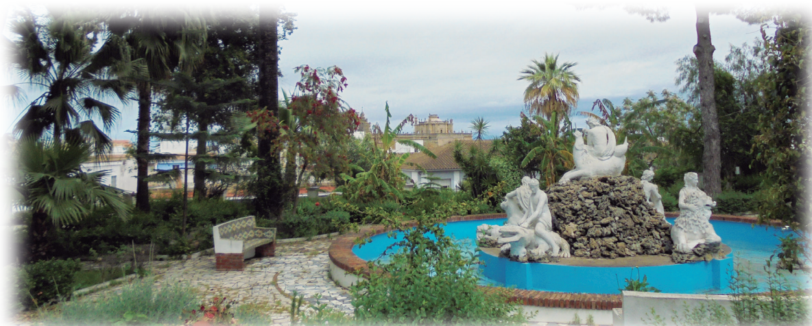
Jardin del colegio Divina Pastora. Sanlúcar de Barrameda