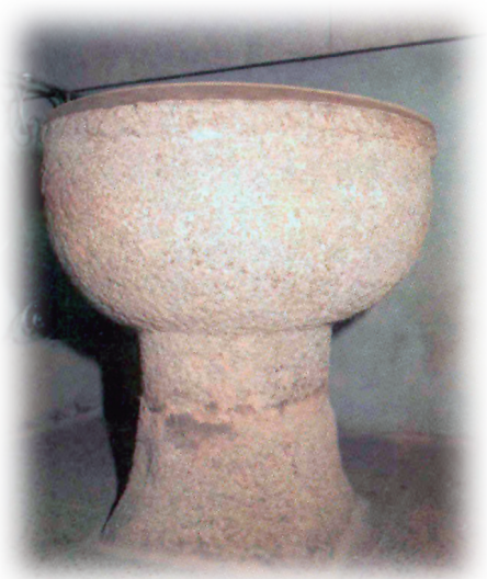
Pila bautismal. Parroquia S. Jorge. Acebedo del Río