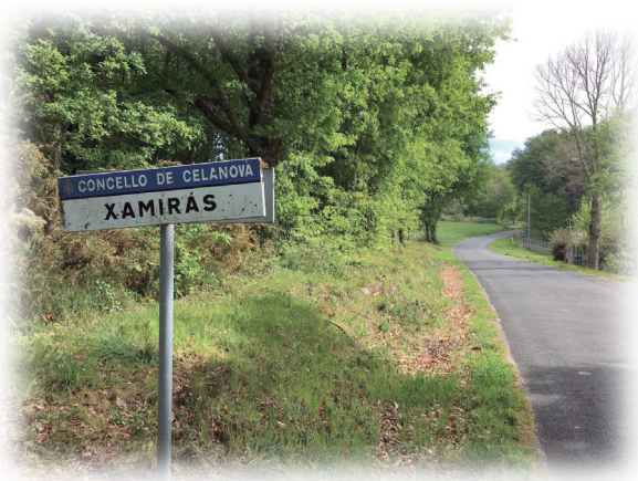
Entrada a la aldea donde nació Faustino Míguez