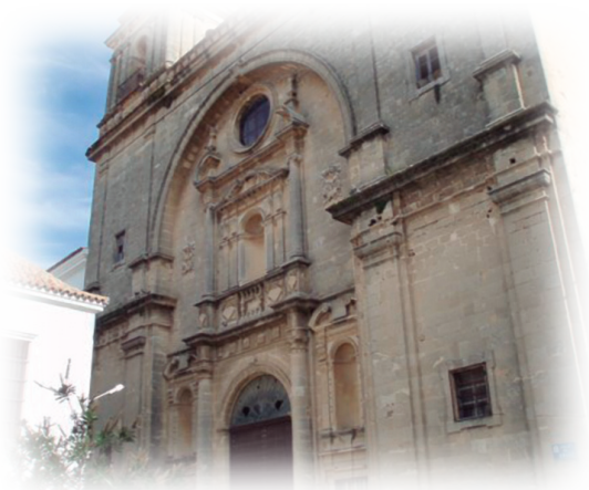
Iglesia de S. Francisco. Sanlúcar de Barrameda