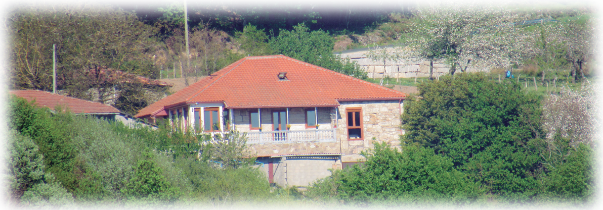
Xamiras. Casa de la familia Míguez