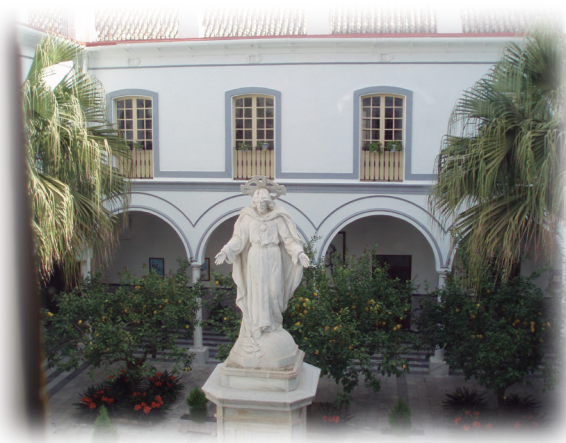
Patio central del colegio de los PP. Escolapios en Sanlúcar de Barrameda