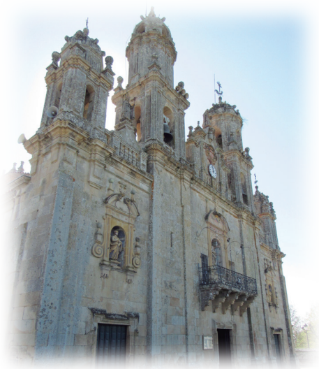
Santuario de Ntra. Sra. de los Milagros